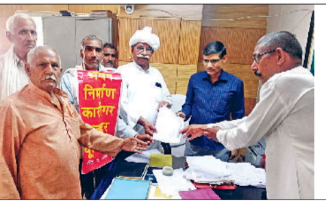
नारनौल। डीसी कार्यालय के सुपरिंडेंट को ज्ञापन देते हुए।