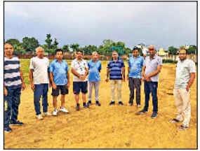
महेन्द्रगढ़। खेल स्टेडियम का निरीक्षण करते विधायक।