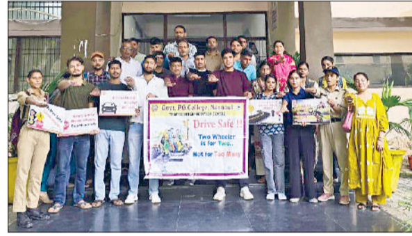
नारनौल। जागरूकता कार्यक्रम में भाग लेते विद्यार्थी व कॉलेज स्टाफ।