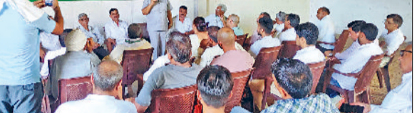
नारनौल। बैठक करते जजपा कार्यकर्ता।

जिला कार्यालय में जजपा कार्यकर्ताओं की हुई बैठक