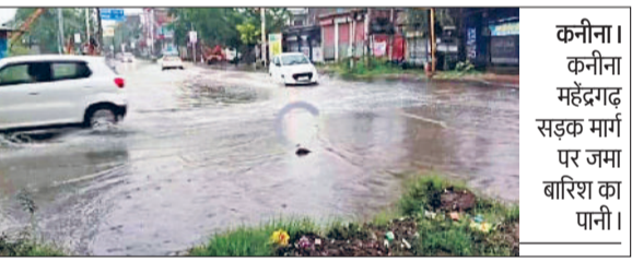
कनीना। कनीना महेंद्रगढ़ सड़क मार्ग पर जमा बरिश का पानी।