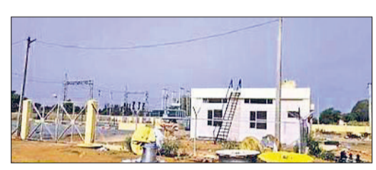
नारनौल। निजामपुर रोड स्थित 33 केवी विद्युत सब स्टेशन।

शहर में बरसात के सीजन में बिजली कटौती एक बड़ी समस्या बन गई है। शहर के अधिकांश हिस्सों में लंबे समय तक बिजली कटौती हो रही है, जिससे आमजन परेशान हैं। पॉश कॉलोनी और अधिकारियों के आवासों को छोड़कर बाकी शहर में बिजली कटौती की समस्या अधिक है। कमाल की बात यह है कि बरसात होने के बावजूद गर्मी एवं उमस से लोग परेशान रहते हैं। रात्रि को मच्छरों के आतंक ने लोगों की नींद हराया कर रखी है। दिन रात इतनी भारी मात्रा में बिजली कटौती की जा रही है कि लोगों को न दिन में चैन है और न रात्रि को नींद। आमजन बिजली शिकायत केंद्र एवं अधिकारियों को फोन लगा-लगाकर परेशान होते रहते हैं, लेकिन उनकी सुनवाई नहीं हो रही। पिछले दो दिनों से तो भारी मात्रा में पॉवर कट लग रहे हैं। बीती