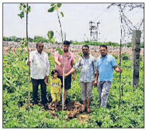
महेन्द्रगढ़। गांव में त्रिवेणी लगाते टीम के सदस्य।