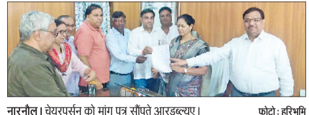
नारनौल। चेयरपर्सन को मांग पत्र सौंपते आरडब्ल्यू।