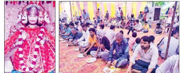
नारनौल। पंचमुखी हनुमान मूर्ति व भंडारे के दौरान प्रसाद ग्रहण करते भक्तगण।