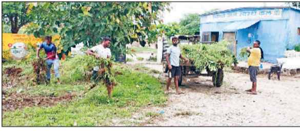
नारनौल। सफाई अभियान के तहत सफाई करते ग्रामीण।

जिले में इन दिनों एक अभूतपूर्व परिवर्तन देखने को मिल रहा है। सघन स्वच्छता अभियान अब केवल एक सरकारी पहल नहीं, बल्कि जन जन के हृदय में उतर चुका एक ऐसा संकल्प बन गया है, जो प्रशासनिक के स्वच्छ भारत अभियान और हरियाणा के मुख्यमंत्री के स्वच्छ हरियाणा स्वस्थ हरियाणा के स्वप्न को मूर्त रूप दे रहा है। यह अभियान जिले के प्रत्येक नागरिक को अपने साथ जोड़कर स्वच्छता के प्रति एक नई अलख जगा रहा है। इसकी गूँज अब हर गली मोहल्ले में सुनाई दे रही है। इसी कड़ी में सोमवार को