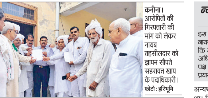
कनीना। आरोपितों की गिरफ्तारी की मांग को लेकर नायब तहसीलदार को ज्ञापन सौंपते सहरावत खाप के पदाधिकारी।